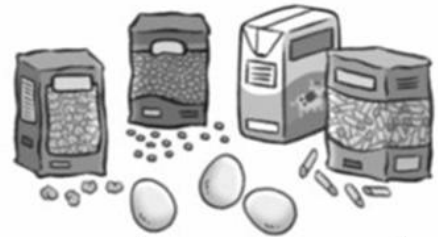
Legumbres y cereales

6-Rodea de rojo los alimentos de origen animal y de verde los de origen vegetal.