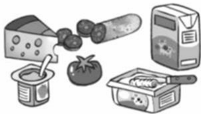
Leche y derivados