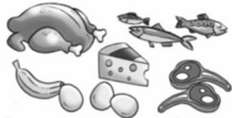
Carnes y pescados