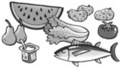
Verduras y frutas

5-Tacha lo que no corresponda en cada grupo: